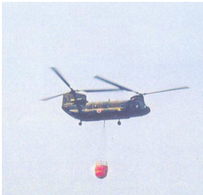
CH-47 から吊下げられたバンビバケット

SEI 社のヘリコプター空中消火用バンビバケットは、機動性に優れたデザインと確かな散水効果に加え、取扱いが容易で、低価格なためユーザーより高い評価と信頼を受けています。バケットの種類は使用するヘリコプターの搭載能力や火災現場の状況に合わせて、最も効率のよいサイズを選ぶことができ、大小あわせて 18 ものタイプがあります。