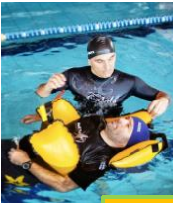
フローティングシステム