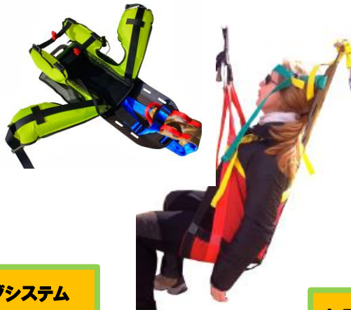
レスキューシート