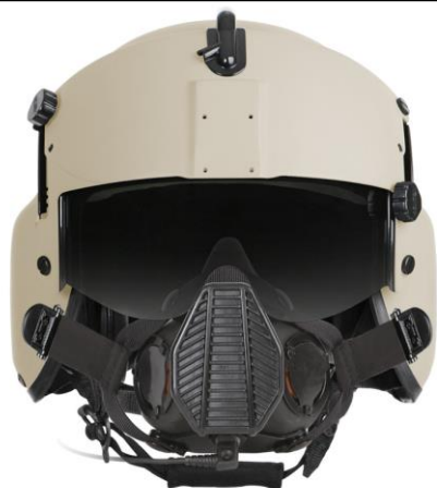
SPH-5, HGU-56/P 装着型