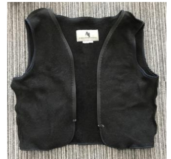
取り外し可能なベスト型ライナー

Aureus 社の Nomex ジャケットは、現在、米軍のパイロットが着用している CWU45/P ジャケット の特徴をすべて備えています。